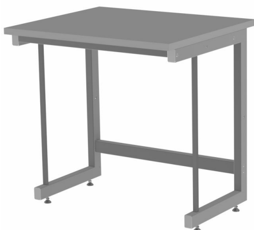
Kovová podnož tvar C doplněna o výztuhu a pohledovým krytem - CH