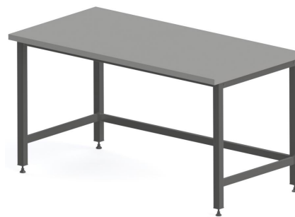
H Kovová podnož tvar "H"