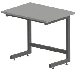
C Kovová podnož tvar "C"