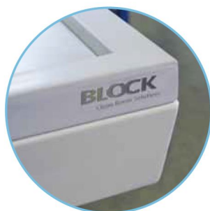
Detail pohledové hrany